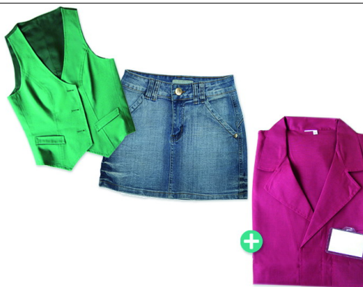
Cotone e tessuti naturali e sintetici colorati o di colore scuro.

Stampanti OKI CMYK A4 e A3 compatibili con la tecnologia No Cut TOPWEED - vedi elenco completo sul sito + termopressa